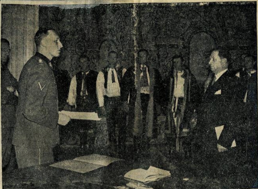
Der Stellvertretende Reichsprotector SS-Obergruppenführer Heydrich bei seiner Ansprache