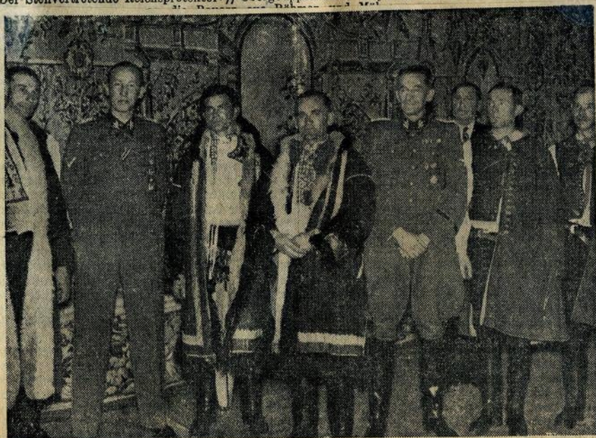
Der Stellvertretende Reichsprotector SS-Obergruppenführer Heydrich und Staatssekretär SS-Gruppenführer Frank im Kreise mährischer Bauern.