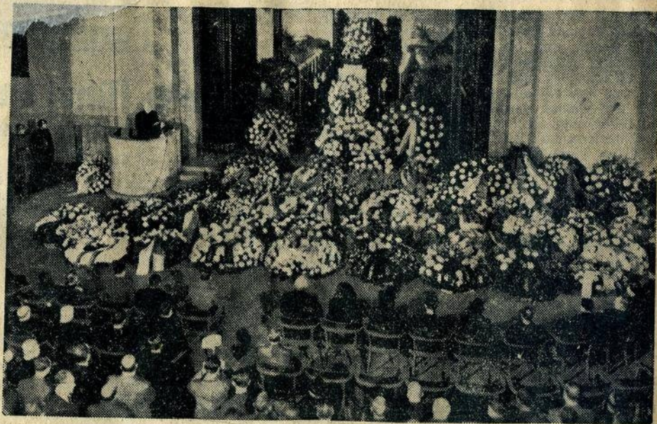
Die Beisetzungsfeier für den ermordeten tschechischen Publizisten Karl Lažnovský, die Donnerstag im Weinberger Krematorium stattfand.