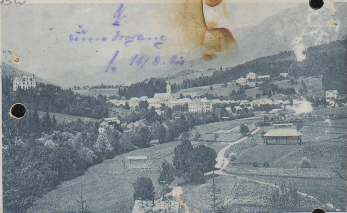
Kerns im Gailtale