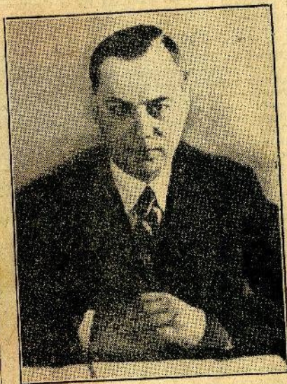
RÍŠSKÝ VEDOUcí ALFRED ROSENBERG se narodil 12. ledna 1893.