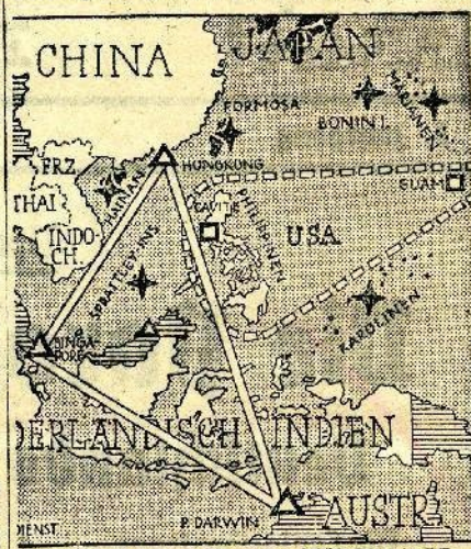
↑ JAP. △ BRIT. □ USA - STÜTZPUNKTE

In Betrachtung der Einzelheiten des Rüstungshaushaltes der USA, nicht Tokio, Maji Schimbun“ der aggressiven Tendenz gegenüber dem Pazifik besondere Bedeutung bei. Sie komme zum Ausdruck in der Verstärkung der Flottenbasen in Alaska, dem