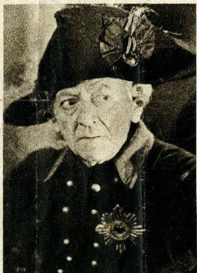
Osobnost velkého krále Pruska je i v dnešní době nezapomenutelnou a nachází svůj nejmarkantnější výraz právě ve filmovém zpracování této vynikající osobnosti: k srovnání přinášíme obraz detailu slavné sochy Fridrichovy od Johanna Gottfrieda Schadowa (Zemské museum pomoranské) a obraz státního herce Otto Gebiura v úloze velkého panovníka ve filmu Tobisu „Velký král“.