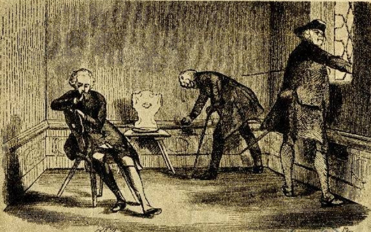
Fridrich ve vězení v Küstrinu. Denní prohlídka službu konajícího důstojníka. (Kresba A. Menzela.)