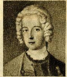
Fridrich v době svého pokusu o útek. (Malba neznámého malíře na hradě Finckenstein.)