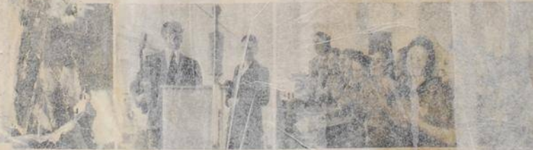
... der DAF... ... als die

...gt alles vorüber“ und die werdenden M... ...lagers das Lied vom „Küpperstorch“. Die... ... aus dem Protektorat... über ihre... ... Spannung war auch dabei, denn in den... ... „pausen“ wurden jeweils Zwischenergebnisse... ...ktion bekanntgegeben. Immer höher kletterten die... ... immer beachtlicher wurde das Ergebnis. Heute... ... Erfolg fest: Je Kopf... überwiegend aus... ... den Gefolgschaft wurden durchschnittlich... ... spendet. Unter den... Gefolgschaft... ... wurden Einzelbeträge... zu zehn Mark... ... So hat die große... Werksgemeinschaft... ... die Spendenliste des deutschen Volkes... ... Spaß, eine Freude, eine bunte, beschwingte... ... Ernst steckte dahinter, ernste Gedanken an... ... an der Front und die... Geschädigten in der... ... Heimat, denen auch die NSV... durch die... ... deutschen Volkes Erleichterung bringt. Die... ... Dankbarkeit an ihre... der NSV... ... dacht und an diese... jene Ferien... ... holsbedürftige in einem NSV-Heim... ... um neue Kraft zu... für den Alltag.