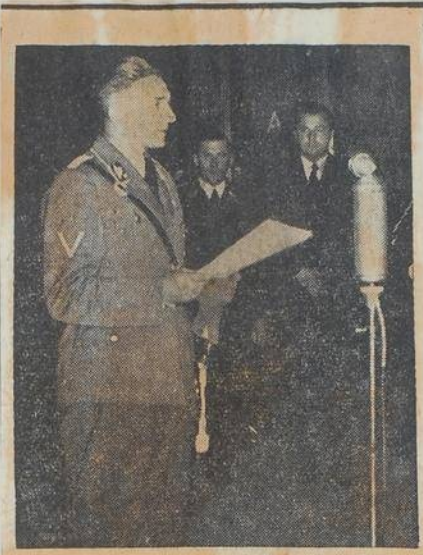
Staatssekretär K. H. Frank bei seiner Ansprache im Reichssender Böhmen.

Ausschnitt aus „Der Kleine Tag“ Nr. 90 vom 8. 7. 39.