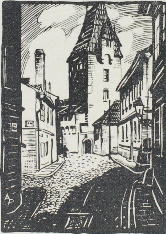
Budweis. Der Rabensteiner Turm

Als mit 6. August 1335 König Johann von Böhmen den Bürgern von Budweis das Recht verleiht, jeden Einwohner oder Bürger, der ihnen nicht genehm ist, aus der Stadt zu weisen, da ermächtigt er sie gleichzeitig, ein U n g e l d einzuhoben, wobei ausdrücklich in der Urkunde dies deutsche