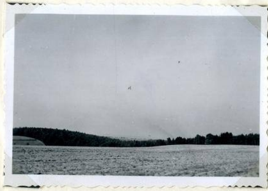
1 Vom Punkt 393 auf der Strasse zwischen Poršice- Beneschau in westlicher Richtung. ( KZ. 270 )